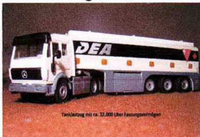
Tanklastzug mit ca. 32.000 Liter Fassungsvermögen

Die Stadtwerke Bad Homburg haben uns 2013 eine Trink- und Abwasserrechnung (als Differenzbetrag zu den bezahlten Abschlägen) von € 3.961,81 für den Bezug und Entsorgung von 1.106 m 3 Wasser für das Jahr 2012 zugesandt. Da unser Wasser- und Abwasserverbrauch zwischen 81 und 124 m 3 /a über einen Zeitraum von 14 Jahren betrug, habe ich des lieben Friedens willens 106 m 3 bezahlt und gegen die Berechnung der 1.000 m 3 Widerspruch eingelegt. Die Argumente gingen hin und her, eine weitere Wassergebührenforderung der Stadtwerke Bad Homburg für 2013 und 2014 wurde erfolgreich abgewehrt, eine Überprüfung des Wassermengenzählers wurde durchgeführt (Befundprüfung ergab keine Fehler) und schließlich mein Widerspruch zurückgewiesen. Damit blieb nur noch der Klageweg für mich offen, was ich auch getan habe. Dabei habe ich – nebenbei bemerkt – in der Klageerwiderung noch persönliche Diffamierungen zur Kenntnis nehmen müssen.