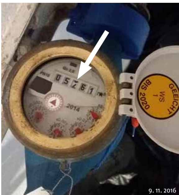
Georg Hofmann hat erstmals einen Rollensprung bei einem Wasserzähler im Bild dokumentieren können. Der Sprung erfolgte um 100 m 3 (von 5360 auf 5461 m 3 ).